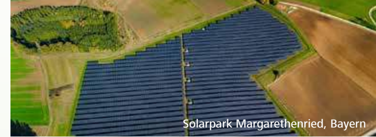
Solarpark Margarethenried, Bayern